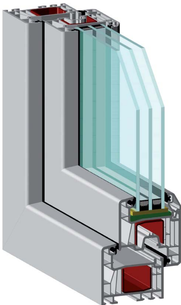
Шестикамерная система EXPROF Experta с 13-миллиметровым фурнитурным пазом