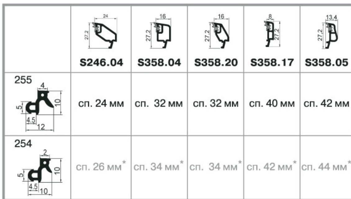
Таблица 2.5 Выбор стеклопакета.

Штапик с постэкструдированным мягким ПВХ, в углах в стык торцами под углом 45°/ Выбор стеклопакета и штапика см. таблицу 2.5